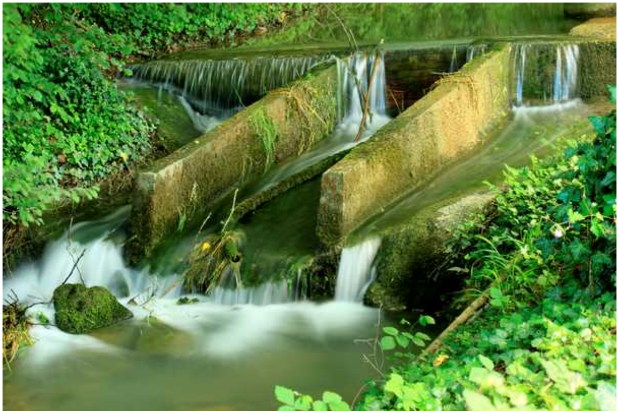
Le barrage sur le rû du Pic

Meilleurs vœux à toutes et à tous pour cette nouvelle année 2013