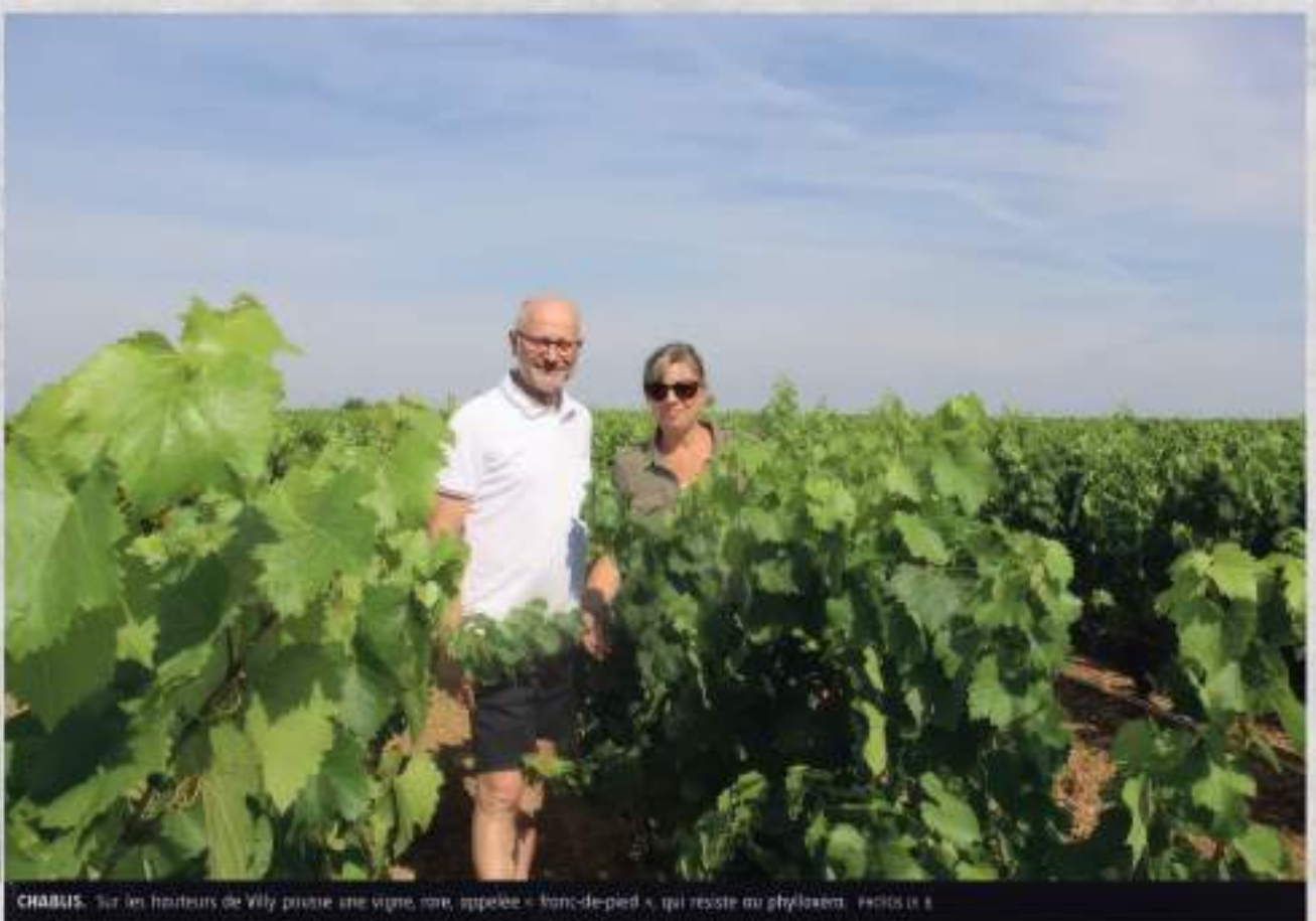
CHABLIS. Sur les hauteurs de Villy prusse, une vigne rare, appelée « franc-de-pied », qui résiste au phylloxéra.

Un article du journal "Yonne Républicaine" du 29 juillet 2022 qui parle d'une vigne dans notre finage.